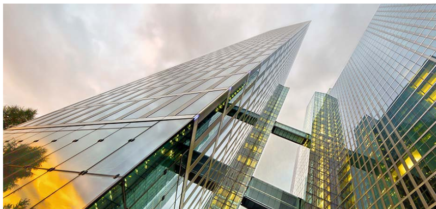
Der Hauptsitz der MEP – die Highlight Towers in München

mep-werke.de mep-solarstrom.de facebook.com/MEPWerke youtube.com/user/MEPWerke